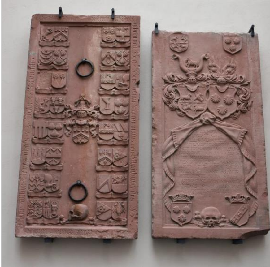
Nische 6: Grab- und Gruftplatten