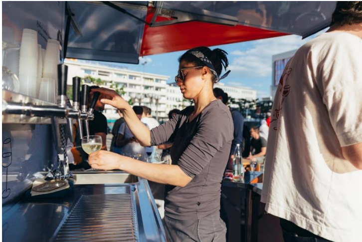
Wein aus Fässern bei Ebb & Flow Keg