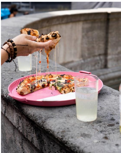
Pizza von Pop-up- Gastronom Sprezzatura