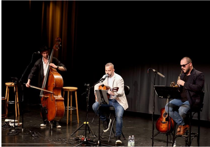
Faber Sanna & Friends, Foto mit freundlicher Genehmigung von Fabrizio Sanna