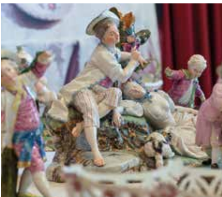
Porzellane im Kronberger Haus