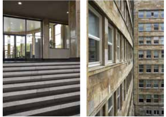
Laura J. Padgett, Confounding Diptychon , Frankfurt 2023