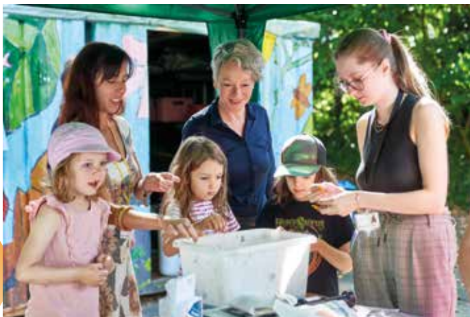
Kulturdezernentin Ina Hartwig ist zu Gast beim JuM unterwegs in Rödelheim anlässlich der Pressekonferenz zum 25. Jubiläum.

Fünf Monate lang, an fünf bis sieben Tagen pro Woche, bei Wind und Wetter, ist das Junge Museum unterwegs für jeweils drei Stunden zu Gast in den Frankfurter Quartieren. Nun schon seit 25 Jahren geht das Junge Museum aus der Innenstadt heraus und kommt mit Sack und Pack in die Stadtteile. Es besucht die Kinder zu Hause und bringt Ideen, Kreativität und ein Stück aktives Museum mit. So wirkt es in den urbanen Raum hinein, ist im soziokulturellen Umfeld tätig und bewegt sich zwischen sozialer Verpflichtung und allgemeinem Bildungsauftrag – das ist untypisch für ein Museum, gehört jedoch zum Selbstverständnis des Jungen Museums Frankfurt. [SG]