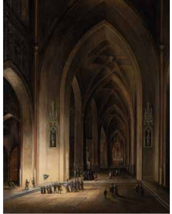
rechts: Johann Ludwig Ernst Morgenstern, Interieur einer gotische Kirche bei Nacht, 1811 HMF.B.2016.009