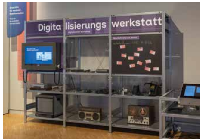
unten: Digitalisierungs-Werkstatt in der Ausstellung „Zeitzeugenschaft? Ein Erinnerungslabor“