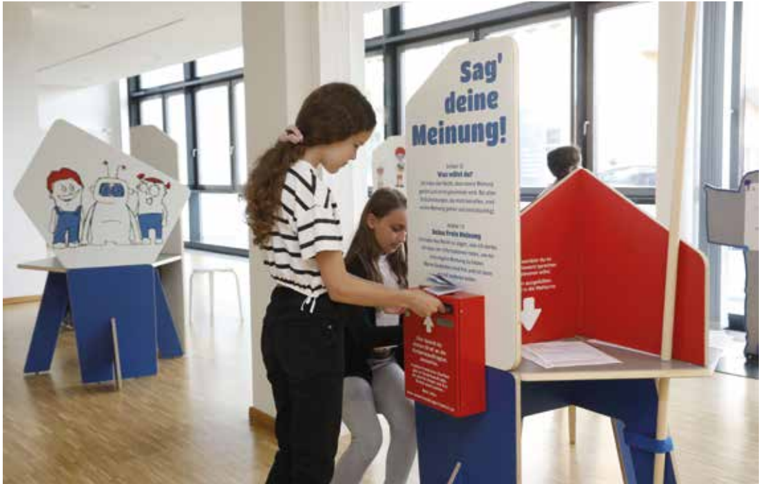
An der Station „Sag deine Meinung“ können Kinder ihre Forderungen an die Kinderbeauftragten abgeben.