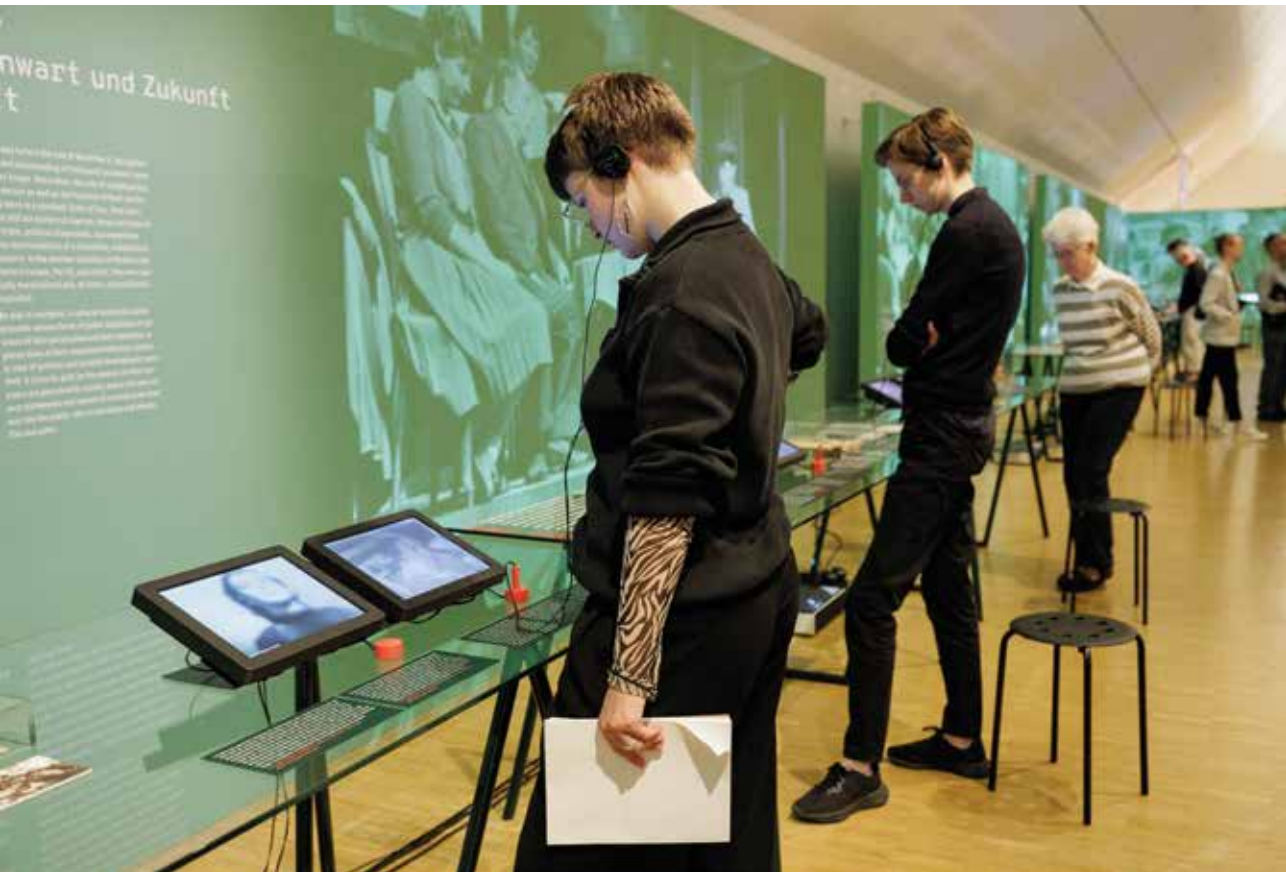
In der Wanderausstellung „Ende der Zeitzeugenschaft?“ sind Videointerviews mit Überlebenden der Shoah zu sehen.

In Kooperation mit dem Fritz Bauer Institut Frankfurt, basierend auf der Ausstellung „Ende der Zeitzeugenschaft?“ des Jüdischen Museum Hohenems und der Gedenkstätte Flossenbürg