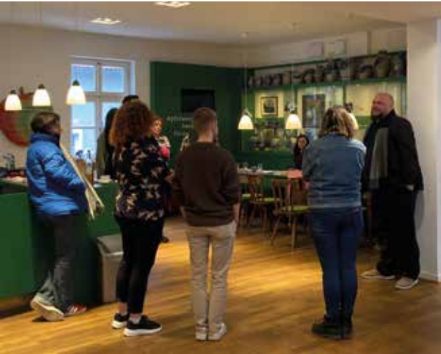
Die Teilnehmenden des Kurses „Sprache der Dinge“ sind zu Gast im Stadtmuseum Neu-Isenburg.