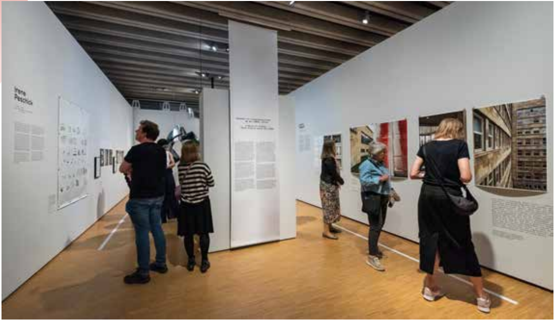
Auch die Arbeiten 20 zeitgenössischer Fotografinnen waren in der Sonderausstellung zu sehen.