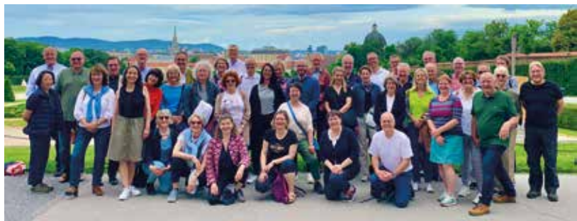
Die Freunde & Förderer bei ihrer Reise nach Wien