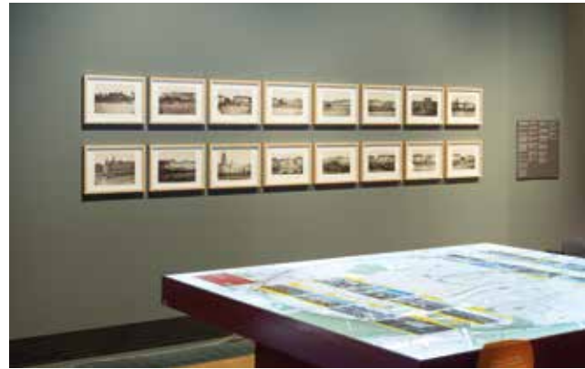
Blickwechsel aufs Mainufer – in Fotografien von Carl Friedrich Mylius