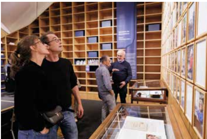
Die Bibliothek der Generationen, ein künstlerisches Langzeit-Erinnerungsprojekt von Sigrid Sigurdsson, ist seit 25 Jahren im HMF beheimatet. Sie ist Bezugspunkt für die Beiträge des Erinnerungslabors.