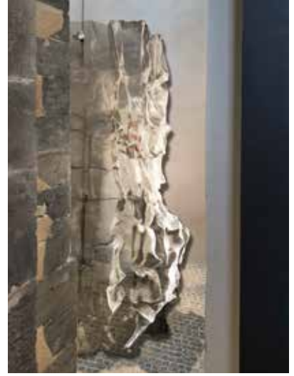
Simulierte Ansicht des Lichthofs mit der Skulptur von Cornelia Heier