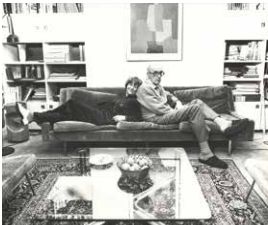
Mara Eggert, Alexander und Margarete Mitscherlich, aus der Serie „Frankfurter Porträts“, Frankfurt 1980 HMF.Ph22324