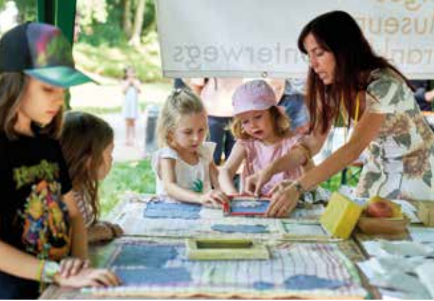
links: Beim Papierschöpfen entsteht Neues aus Altem.