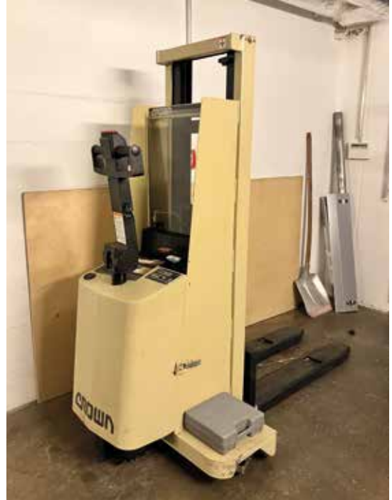
Eine unabdingbare Hilfe: Der Hubwagen