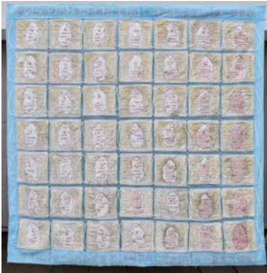
Gisela Hafer, Pandemietagebuch , 2020 HMF.X.2024.057