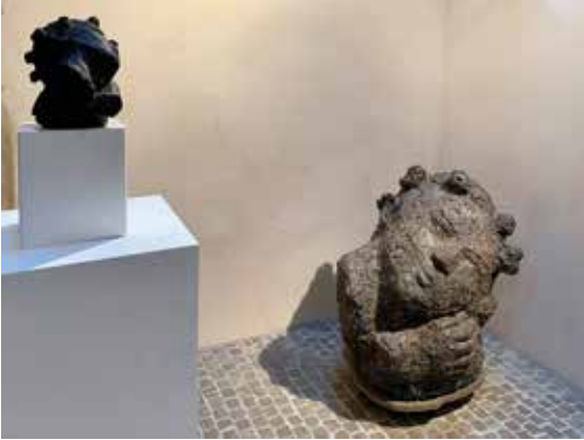
Im Lichthof des HMF sind Arbeiten der Bildhauerin Wanda Pratschke zu sehen.