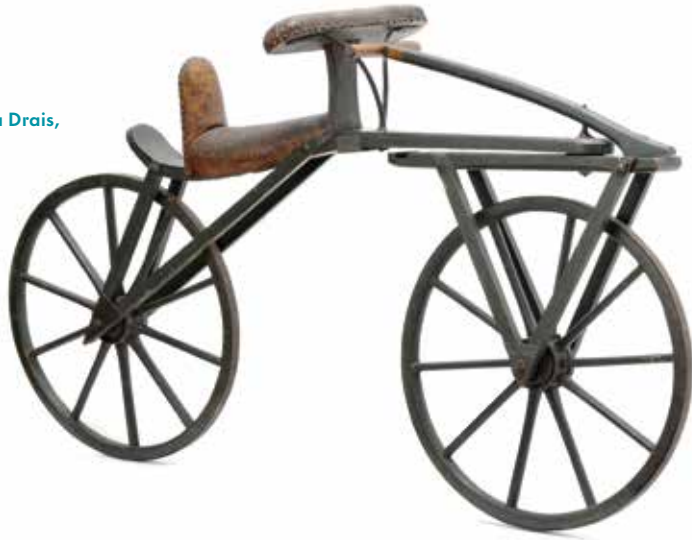
Zeitgenössischer Nachbau der Laufmaschine von Karl von Drais, Mitte 19. Jahrhundert HMF.X14737