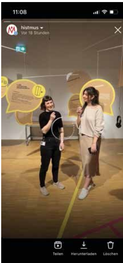
links: Eine Führung mit Instagram-Live durch das Stadtlabor Demokratie

Mit der Digitalisierungs-Werkstatt bieten wir bis zum 4. Mai 2025 „Erste Hilfe“ an: Veraltete Speichermedien können kostenlos digitalisiert werden, damit die Stimmen der Zeitzeug*innen zumindest medial nicht verstummen. Wer möchte, kann sich auch mit Hilfe von Künstlicher Intelligenz unleserliche Handschriften transkribieren lassen. [AJ]