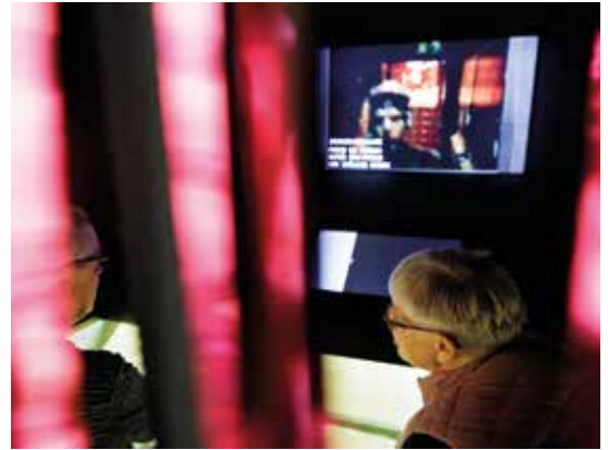
Zeitzeugenschaft ist auch im Film Thema.