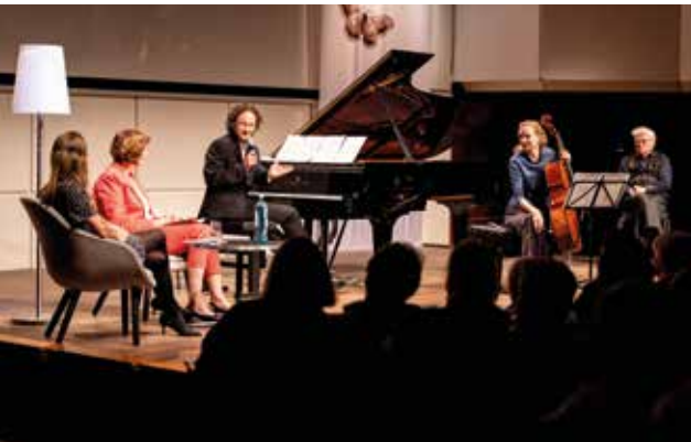
Salon Frankfurt: „Die Welt ein Puppentheater“ am 2. Juni 2024

In Kooperation mit der Alten Oper Frankfurt Mit freundlicher Unterstützung von hr2-kultur Gefördert von der Ernst Max von Grunelius-Stiftung