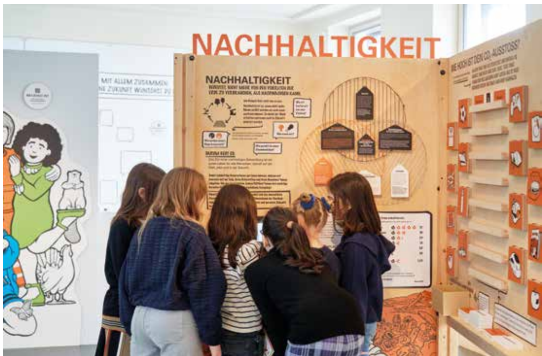
„Umwelt, Klima & DU“ im Jungen Museum Frankfurt