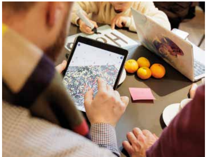
Die Frankfurt History App lädt zur aktiven Teilhabe bei der Content-Erstellung ein.

Die App wird außerdem vom Kulturdezernat und von der Stabsstelle Inklusion der Stadt Frankfurt unterstützt.